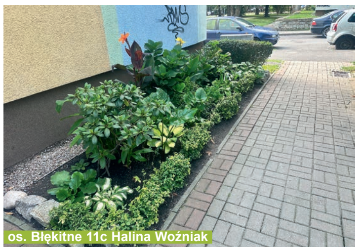
os. Błękitne 11c Halina Woźniak