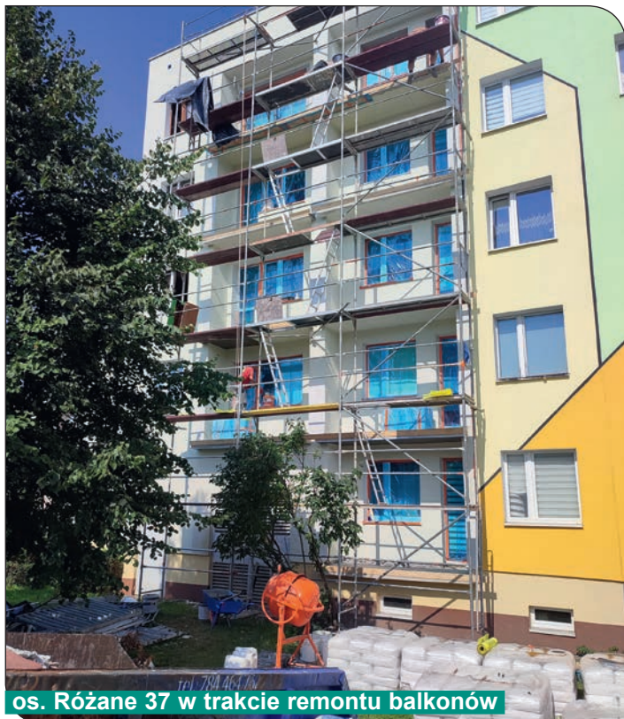
os. Różane 37 w trakcie remontu balkonów

czające tynki. Nad wyremontowanymi balkonami zostały kompleksowo wymienione kratki wentylacyjne w stropodachu. Obecnie w/w prace trwają w budynku na osiedlu Różanym 36a oraz na osiedlu Różanym 36b, pion mieszkań 1, 3, 5, 7, 9.