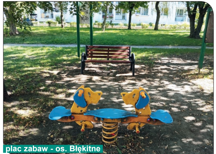
plac zabaw - os. Błękitne