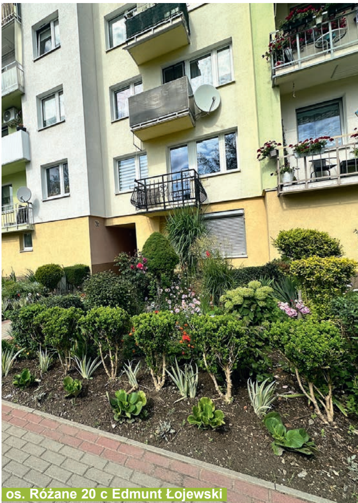
os. Różane 20 c Edmund Łojewski