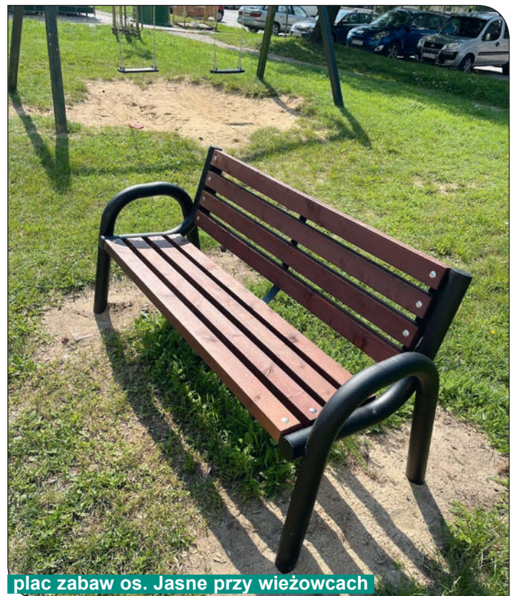
plac zabaw os. Jasne przy wieżowcach