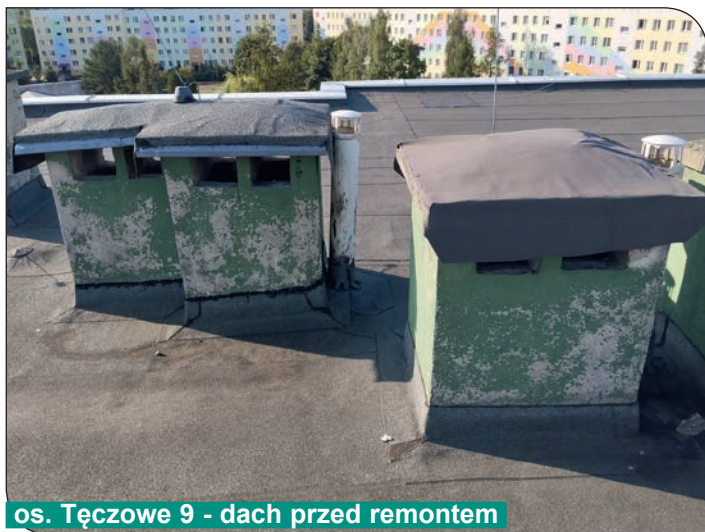
os. Tęczowe 9 - dach przed remontem

• Na osiedlu Tęczowym 9a,b,c – wykonano prace związane z remontem części dachu (klatka a,b,c) w systemie HYDRONYLON. Zakres prac obejmował: renowację i uszczelnienie papowej powierzchni dachu, renowację obróbek blacharskich, remont ścian i czap kominowych.