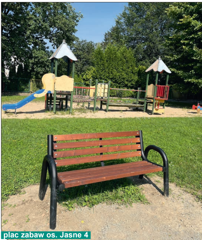
plac zabaw os. Jasne 4