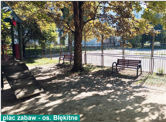
plac zabaw - os. Błękitne

ładnie, ale przede wszystkim są wygodne i bezpieczne.