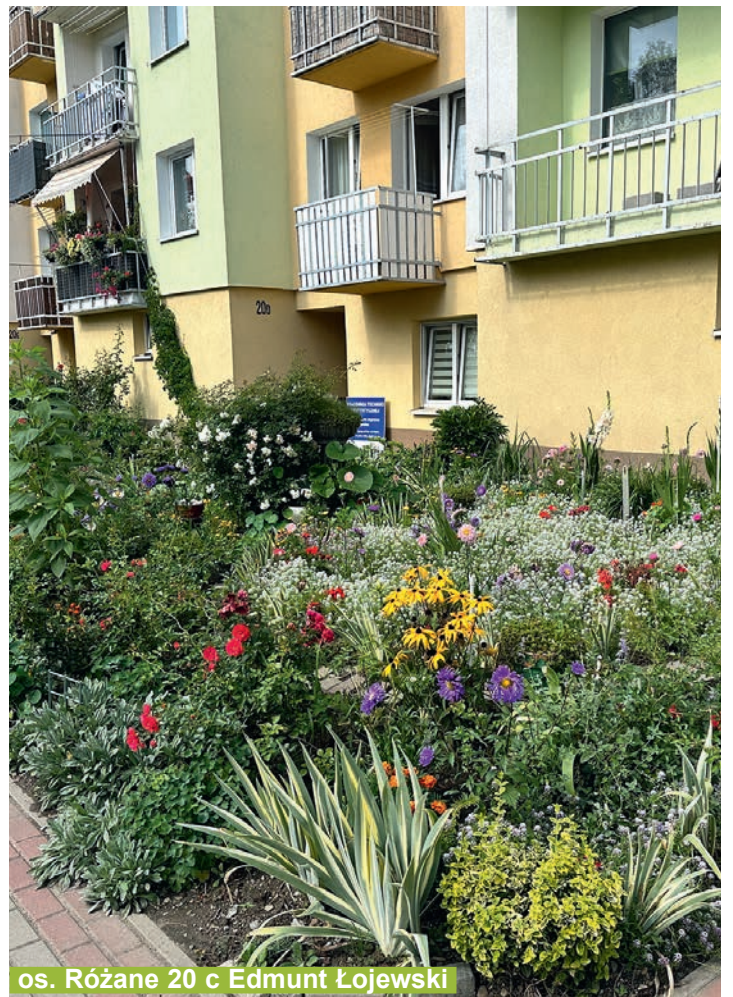
os. Różane 20 c Edmund Łojewski