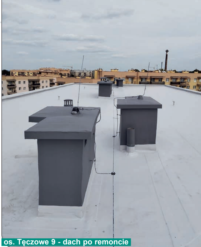
os. Tęczowe 9 - dach po remoncie